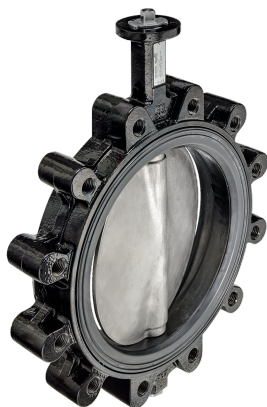
Obrázek se může lišit od produktu