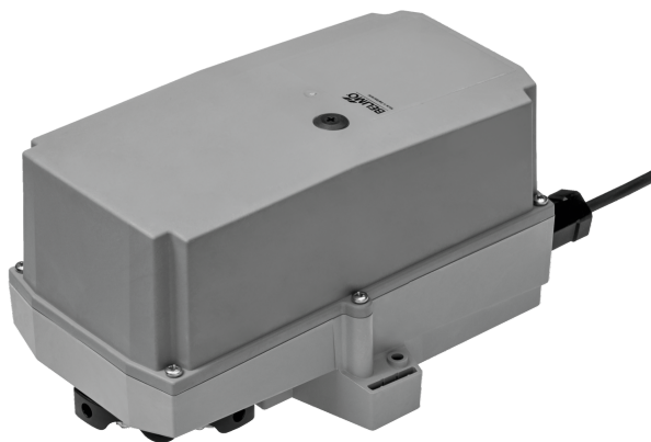
Obrázek se může lišit od produktu